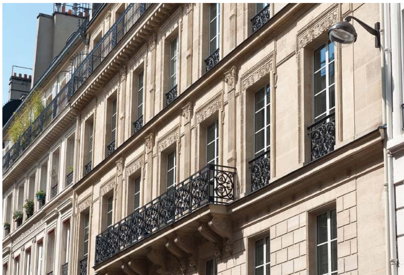
4 rue Castellane - Paris 8 ème .

Dans ce contexte, la collecte nette des SCPI atteint 1,1 milliard d'euros au premier semestre, essentiellement portée par la collecte réalisée pour les SCPI diversifiées.