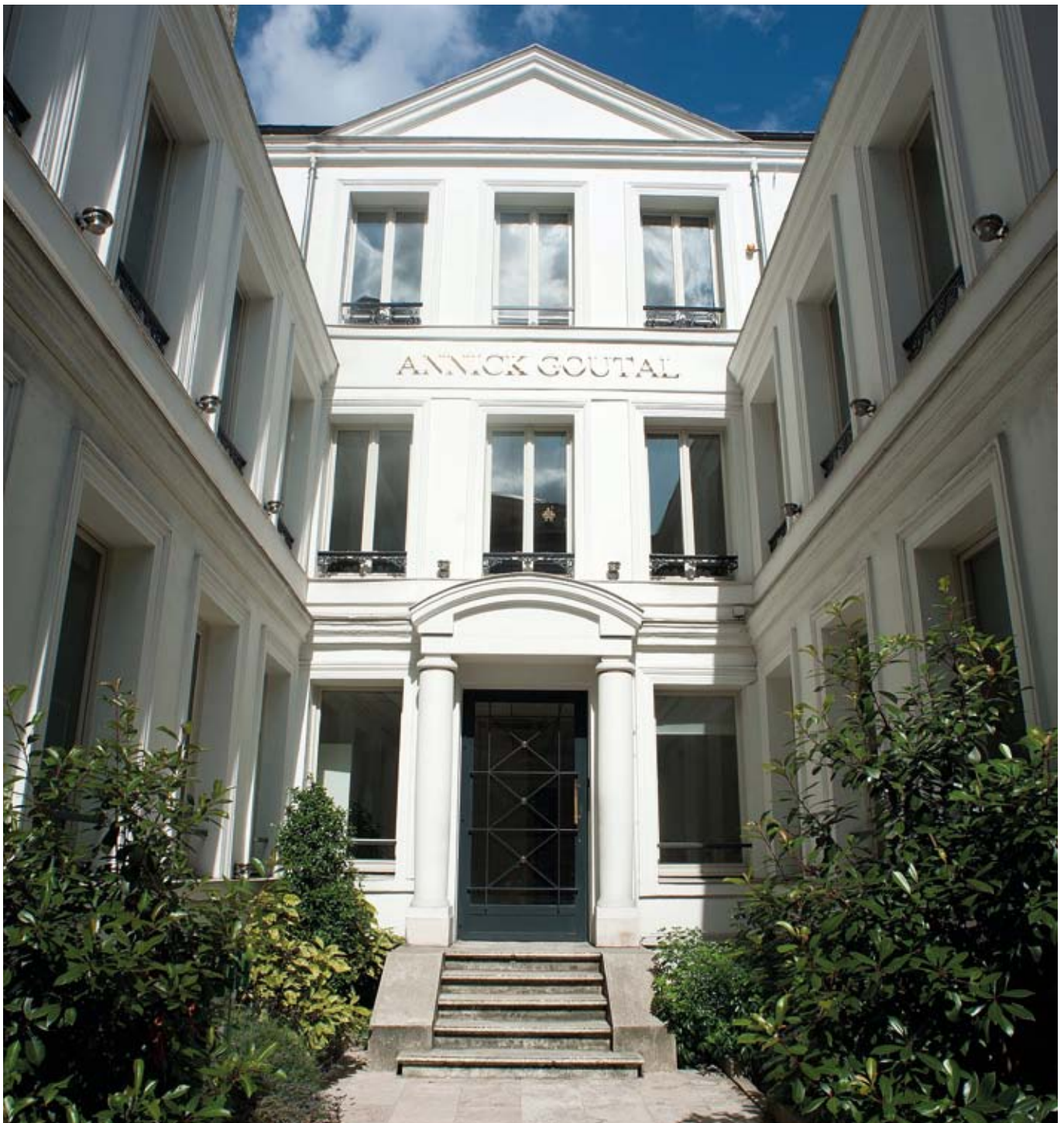
Rue d'Armailié - Paris 17 ème

Il est probable que le Conseil Constitutionnel sera saisi de ce texte à l'issue du vote des assemblées